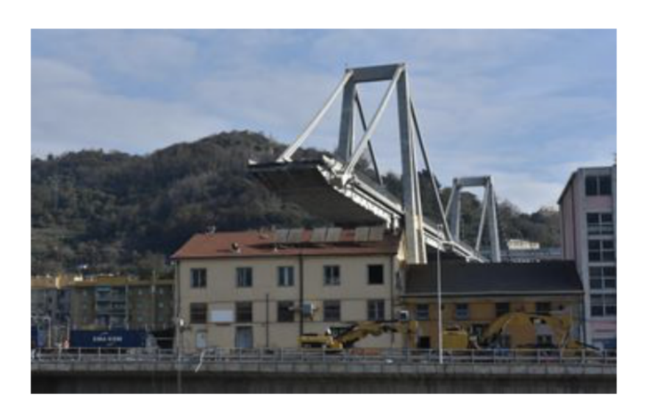
Demolizione del Morandi, Autostrade presenta il piano per smaltire i detriti