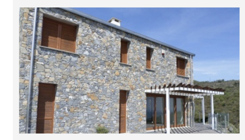
Villa - 483000