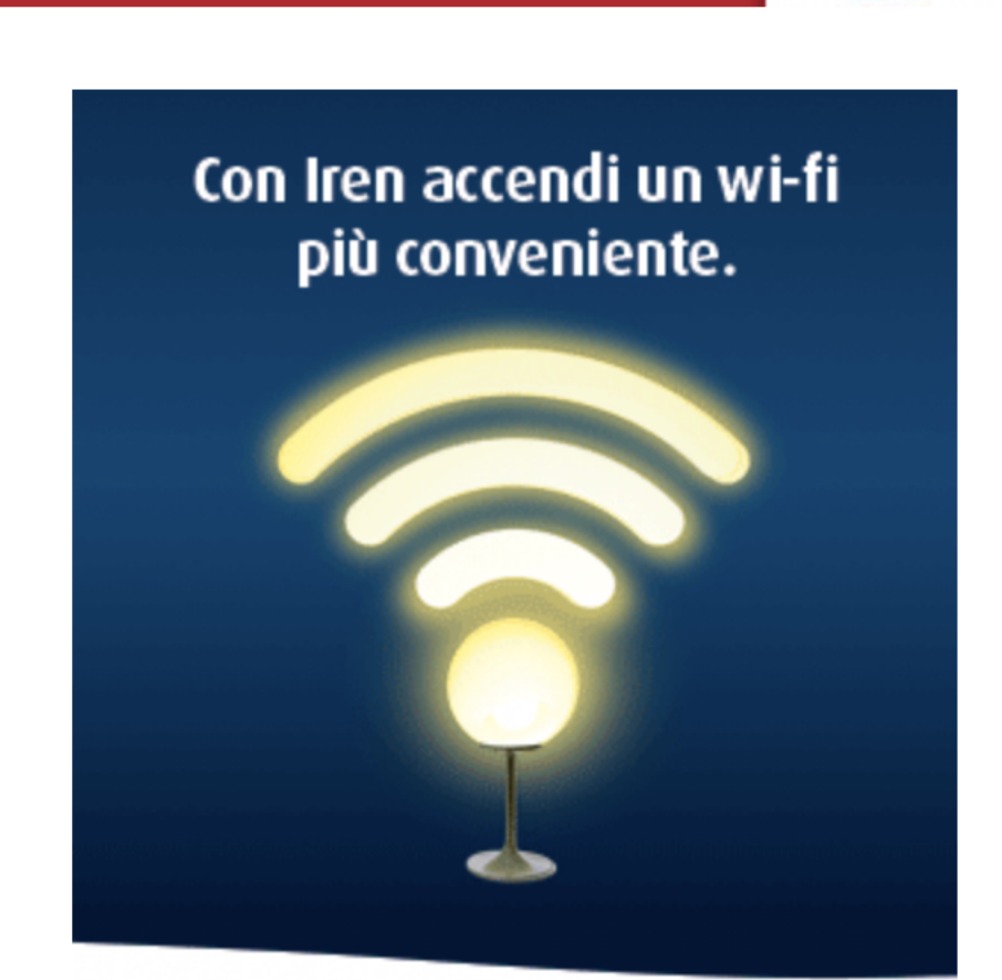
Scopri l'offerta Iren Casa Online.

Para mayor información de fechas y modalidad de participación visita: http://www.marcelaoliveira.it/